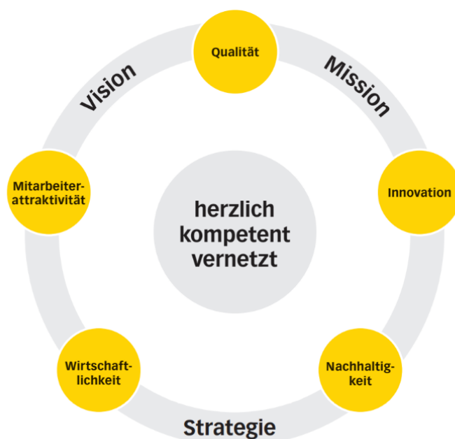
Abbildung 1: Werte und strategische Handlungsfelder der LUKS Gruppe

Herzlich, kompetent, vernetzt. Diese drei Werte stehen im Zentrum der Unternehmensführung der LUKS Gruppe und bilden das Fundament der strategischen Handlungsfelder. Nachhaltigkeit ist eines der fünf strategischen Handlungsfelder der LUKS Gruppe neben Qualität, Innovation, Wirtschaftlichkeit und Mitarbeiterattraktivität.